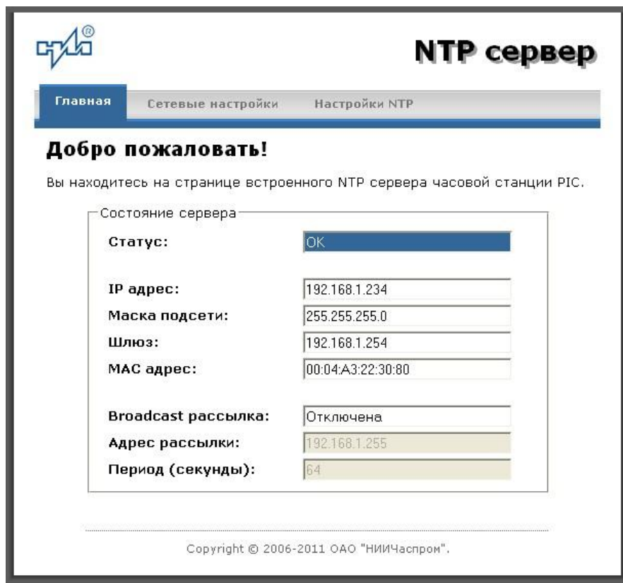
Рис.2 – Главная страница web-интерфеса

Страница «Главная», отображающаяся по умолчанию, содержит информацию о текущем состоянии NTP сервера.